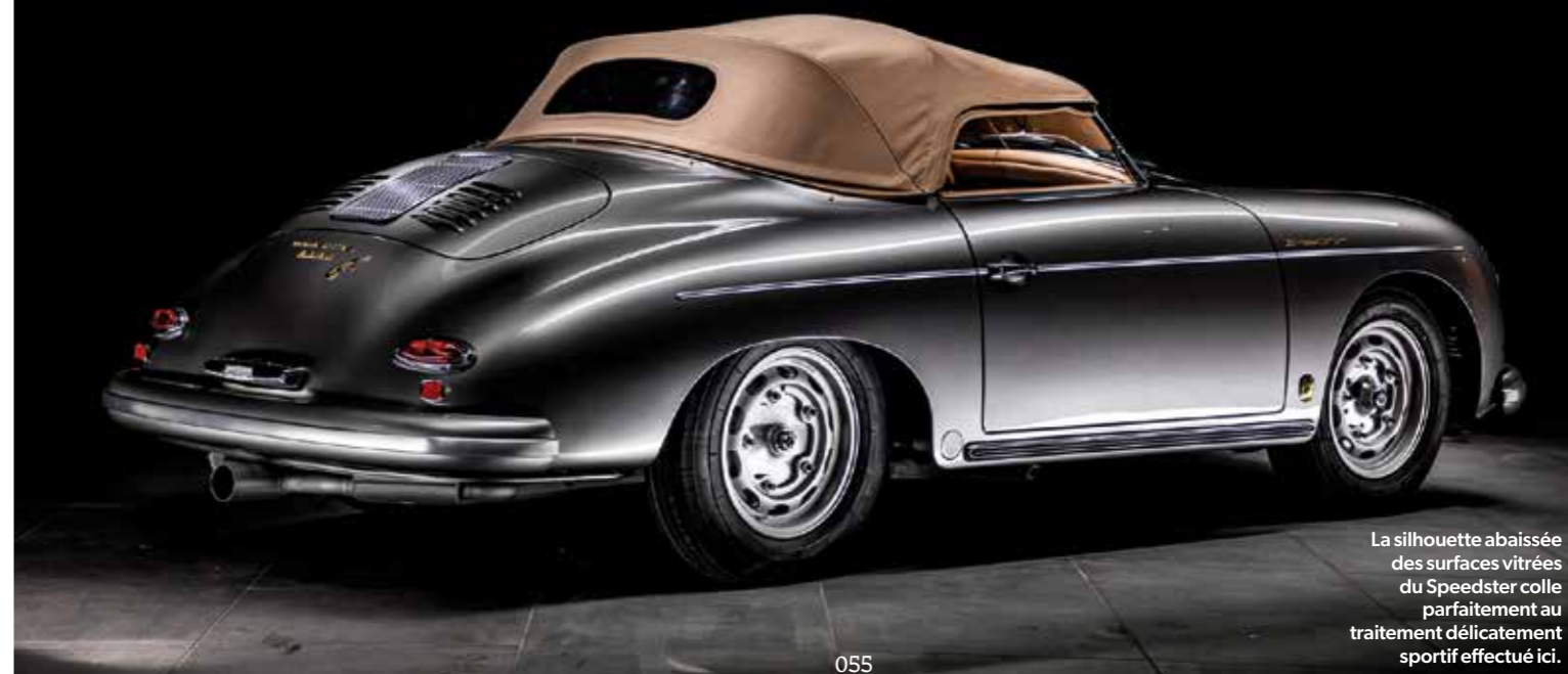
La silhouette abaissée des surfaces vitrées du Speedster colle parfaitement au traitement délicatement sportif effectué ici.