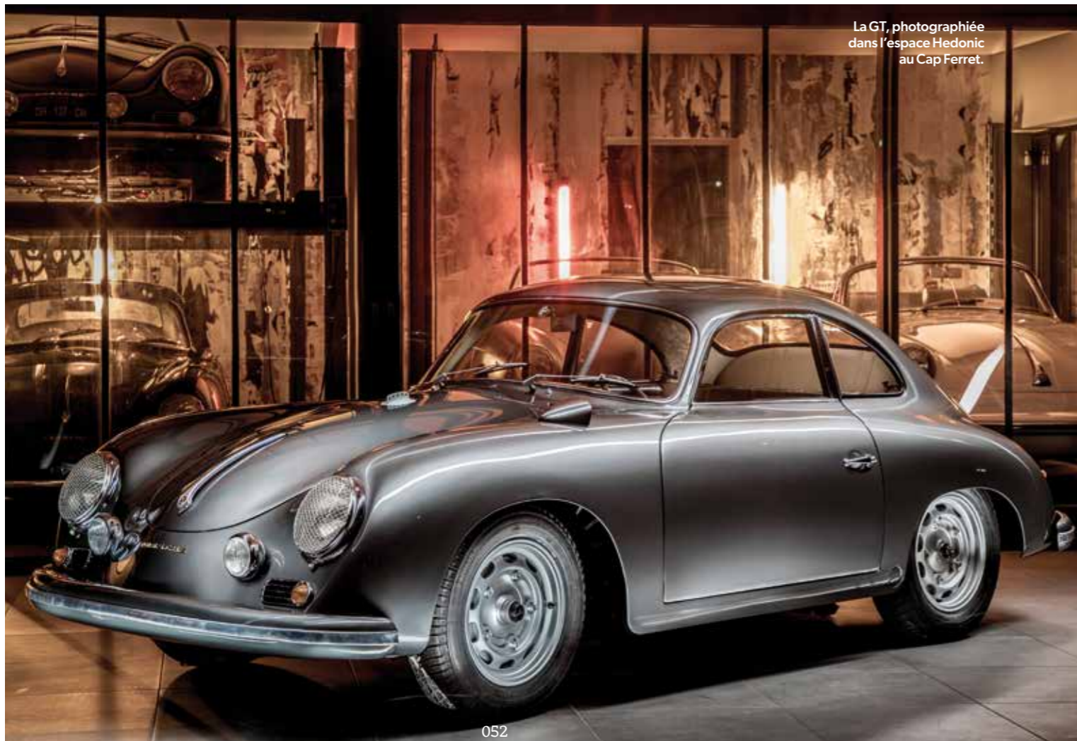
La GT, photographiée dans l'espace Hedonic au Cap Ferret.

Tous ces accessoires de course pouvaient être achetés à l'époque de la voiture. Hedonic les a remis au goût du jour.