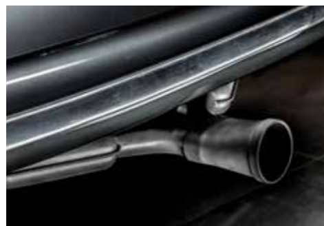
La teinte de carrosserie contribue à l'élégance de l'ensemble.

au quotidien. Le cuir des intérieurs, quant à lui, provient des meilleurs vendeurs, proposant une qualité qui n'existait pas à l'époque d'origine, et les sièges baquets sont spécifiques. Voilà pour le style. Puis Hedonic ajoute de nombreux éléments de confort et de conduite. Ainsi le moteur est-il préparé pour devenir beaucoup plus puissant, les tambours cachent des disques de freins, le système électrique se voit modernisé, les amortisseurs changés pour des modèles modernes et réglables, et on note l'ajout de barres stabilisatrices... En tout, jusqu'à 45 équipements sont présents pour donner un confort de conduite quotidien optimum. Un ensemble moderne, fiabilisé et tout homologué. « Je regarde la qualité, la beauté de chaque élément, explique Serge Heitz. Nous proposons la voiture de base, que nous faisons restaurer. Notre clientèle est très internationale. Tous ces accessoires de course, on pouvait les acheter à l'époque de la voiture. Nous les avons remis au goût du jour et nous faisons ainsi refabriquer certaines pièces. » Voilà donc des préparations très racing chic. Mais rappelons que le métier de base de Serge Heitz est la restauration d'origine. Ici, rien n'est irréversible dans ces préparations et, à tout moment, les voitures peuvent être remises à 100 % dans leur configuration de départ. Dans sa volonté de proposer des personnalisations de plus en plus poussées