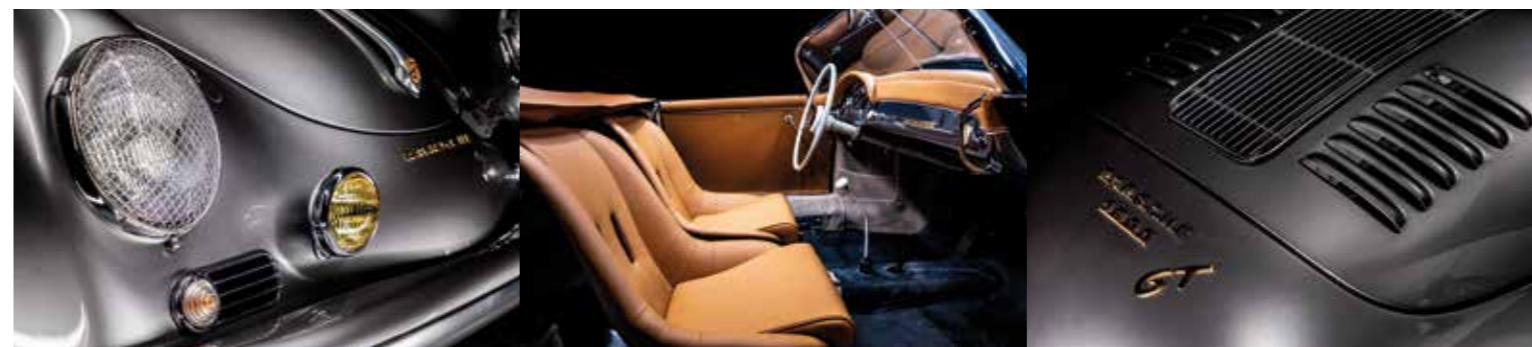
Le soin du détail, la qualité des matériaux et une finition ultra soignée, voilà ce qui caractérise ces réalisations.

Les pièces spécifiques dont elles sont dotées ne sont pas vendues séparément, elles sont exclusives pour ces autos.