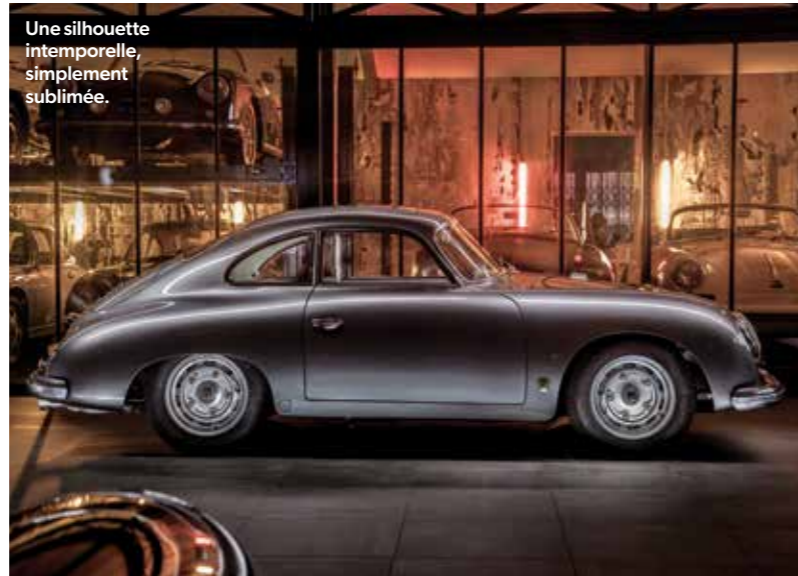
Une silhouette intemporelle, simplement sublimée.